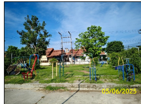
พื้นที่สวนสาธารณะ