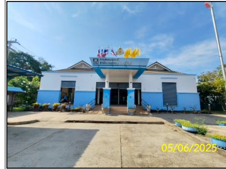
อาคารศูนย์ชุมชน