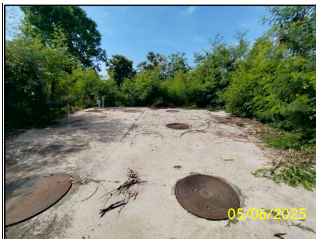
ระบบบำบัดน้ำเสีย