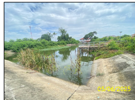
บ่อหนองน้ำ