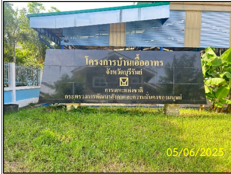
ป้ายชื่อโครงการ