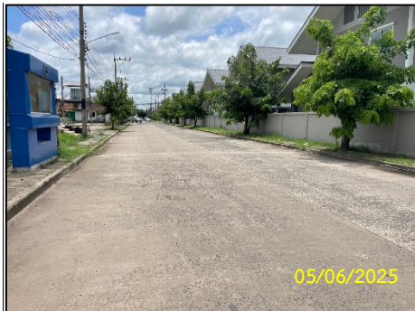
พื้นที่ถนน-ทางเท้า