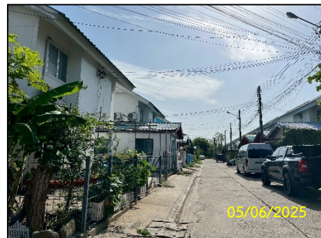
ทิศตะวันตก