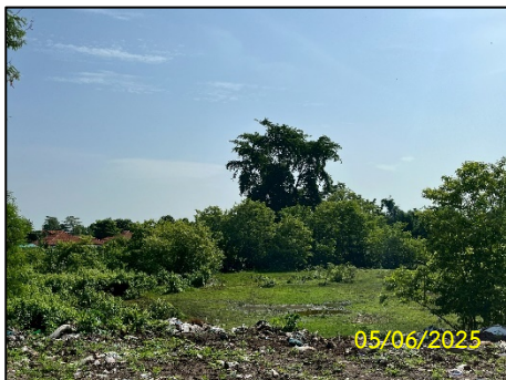
ทิศตะวันออก