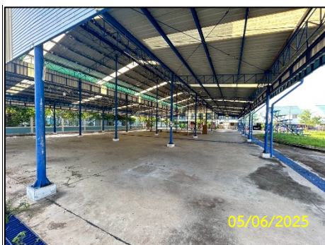
ลานค้าชุมชน