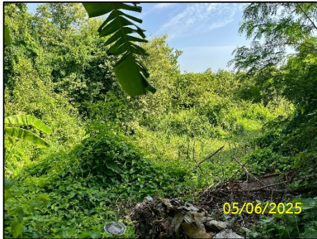
ทิศเหนือ